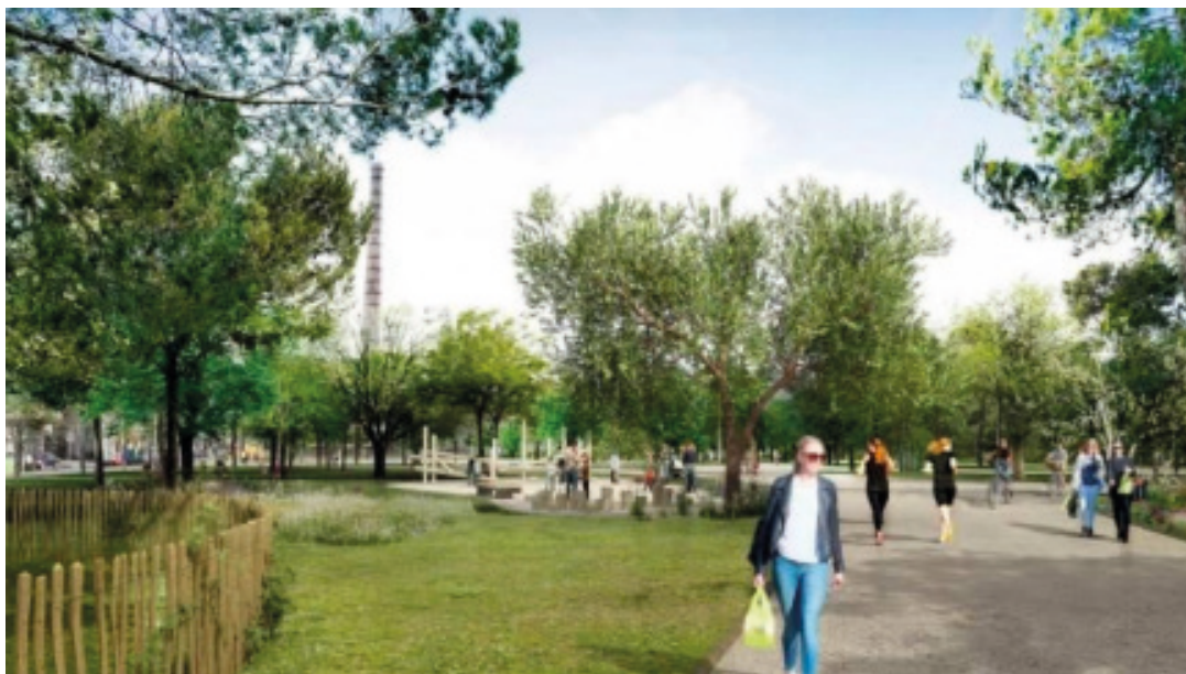
Imatge proposta del parc del Botafoc

El Planejament urbanístic ha d'apostar per zones urbanes compactes, créixer cap a dins! , impedit l'expansió immobiliària on la prestació de serveis bàsics s'encaixen, fins a fer-se insostenible, es consumeixen més recursos energètics i hídrics, i la mobilitat es vincula a l'ús del vehicle privat, amb evidents efectes sobre la salut i la seguretat.