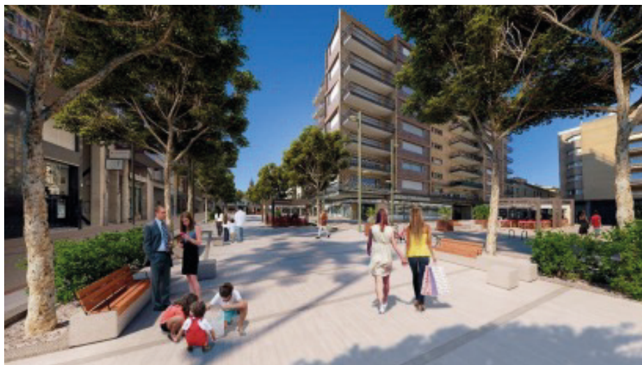
Imatge del projecte de transformació urbana, verda i inclusiva de la Rambla del centre del Vendrell