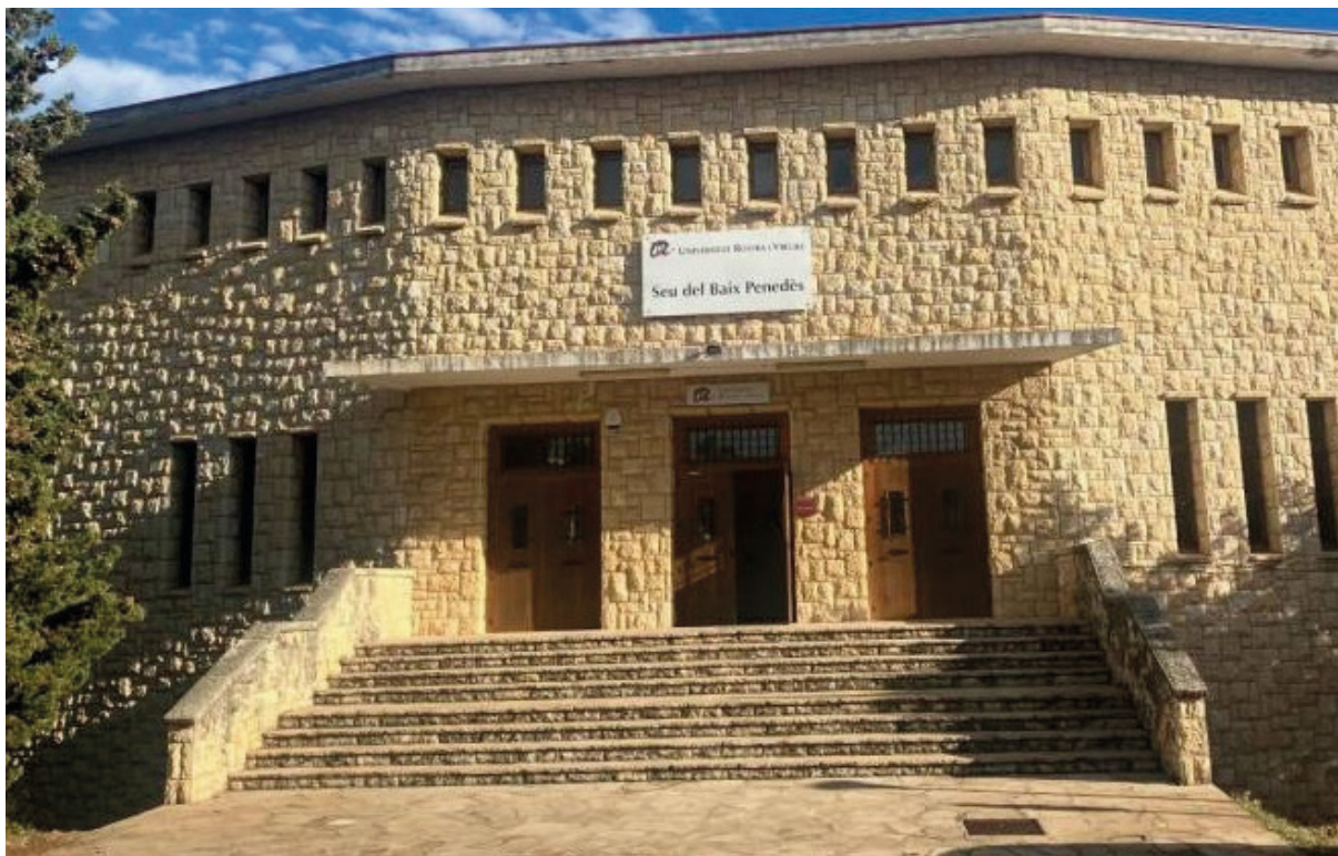
Imatge de la seu universitària de la URV al Vendrell