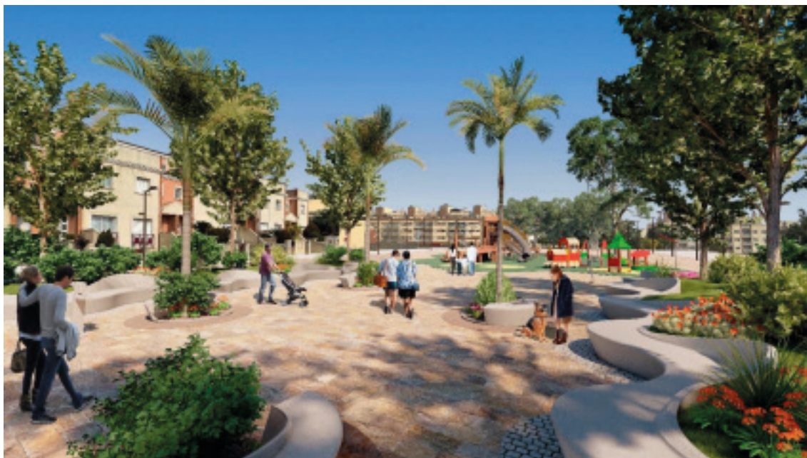
Imatge de la proposta d'ajardinament de la Rambla Cañas

S'impulsarà la infraestructura verda, amb la creació de nous parcs i jardins públics , entre els principals en destaquem: