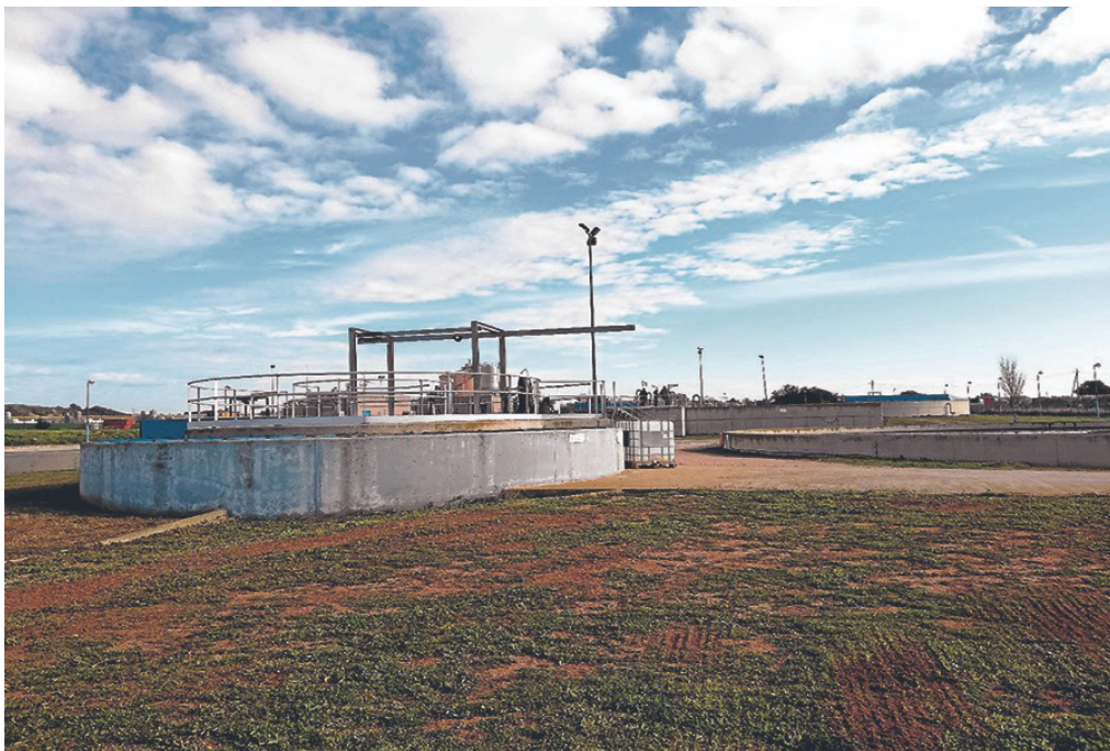
La depuradora de Santa Oliva ha d'esdevenir una Estació de Regeneració de l'Aigua per poder-la aprofitar