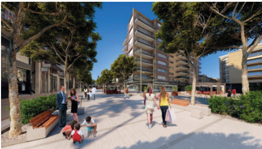
Imatge del projecte de transformació urbana, verda i inclusiva de la Rambla del centre del Vendrell

Aquest mes de maig, la ciutadania del Vendrell té l'oportunitat d'avaluar la feina feta i de recolzar el projecte optimista, de progrés, pensat per a tots i totes, i fet amb totes i tots.